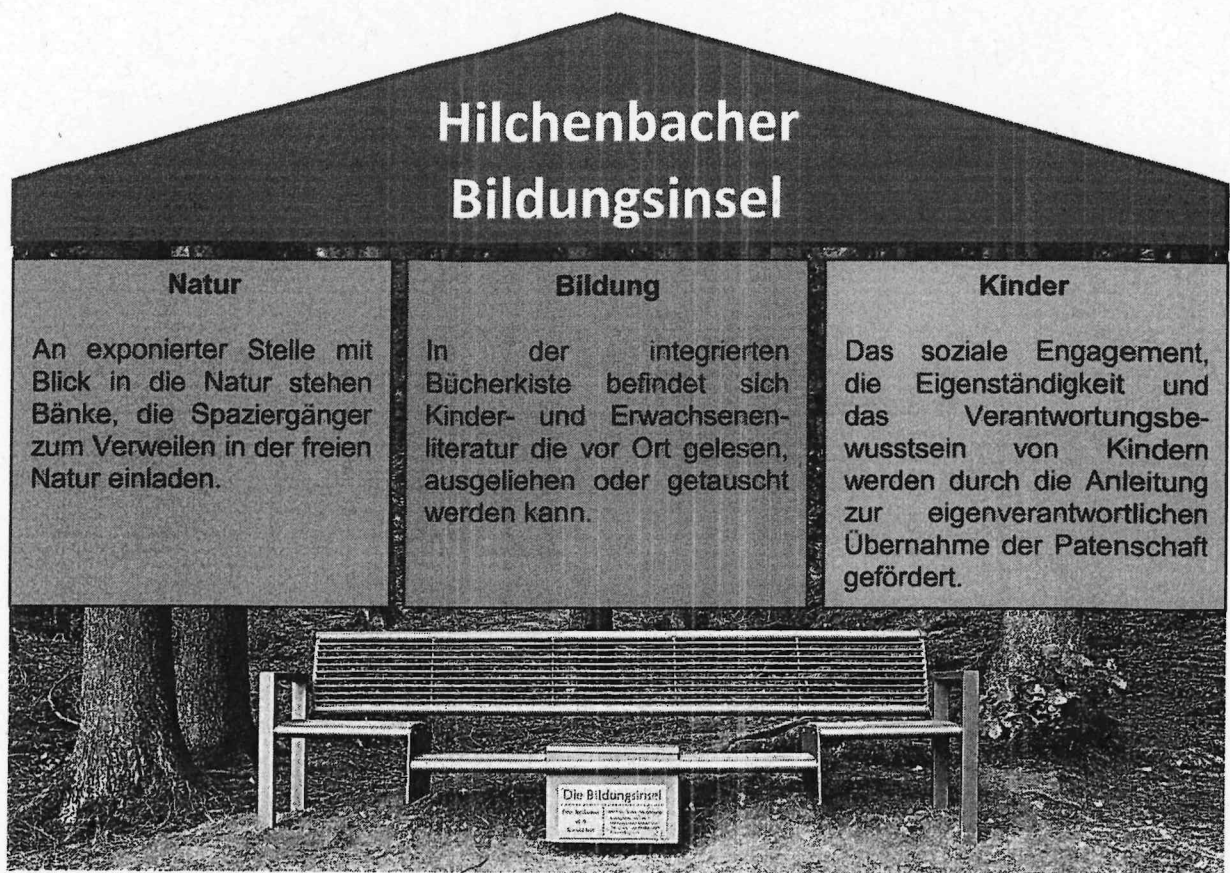
ein Projekt der Hilchenbacher Bildungsinsel e.V.

Das Projekt der „Hilchenbacher Bildungsinsel“ bringt Kinder, Bildung und Natur generationenübergreifend in Einklang. Das Herzstück des Projektes bildet eine Bank, die an exponierter Stelle in der Natur steht.