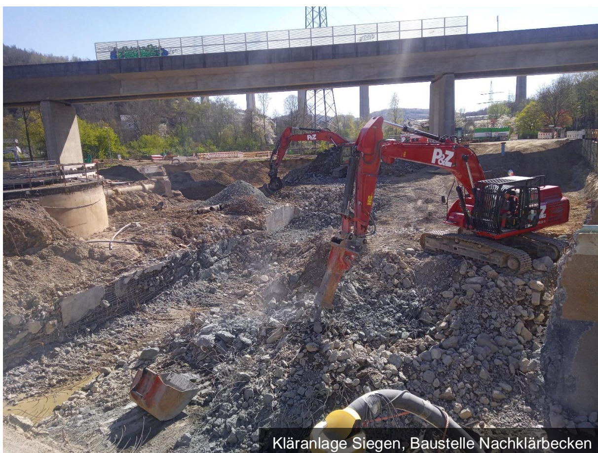
Kläranlage Siegen, Baustelle Nachklärbecken