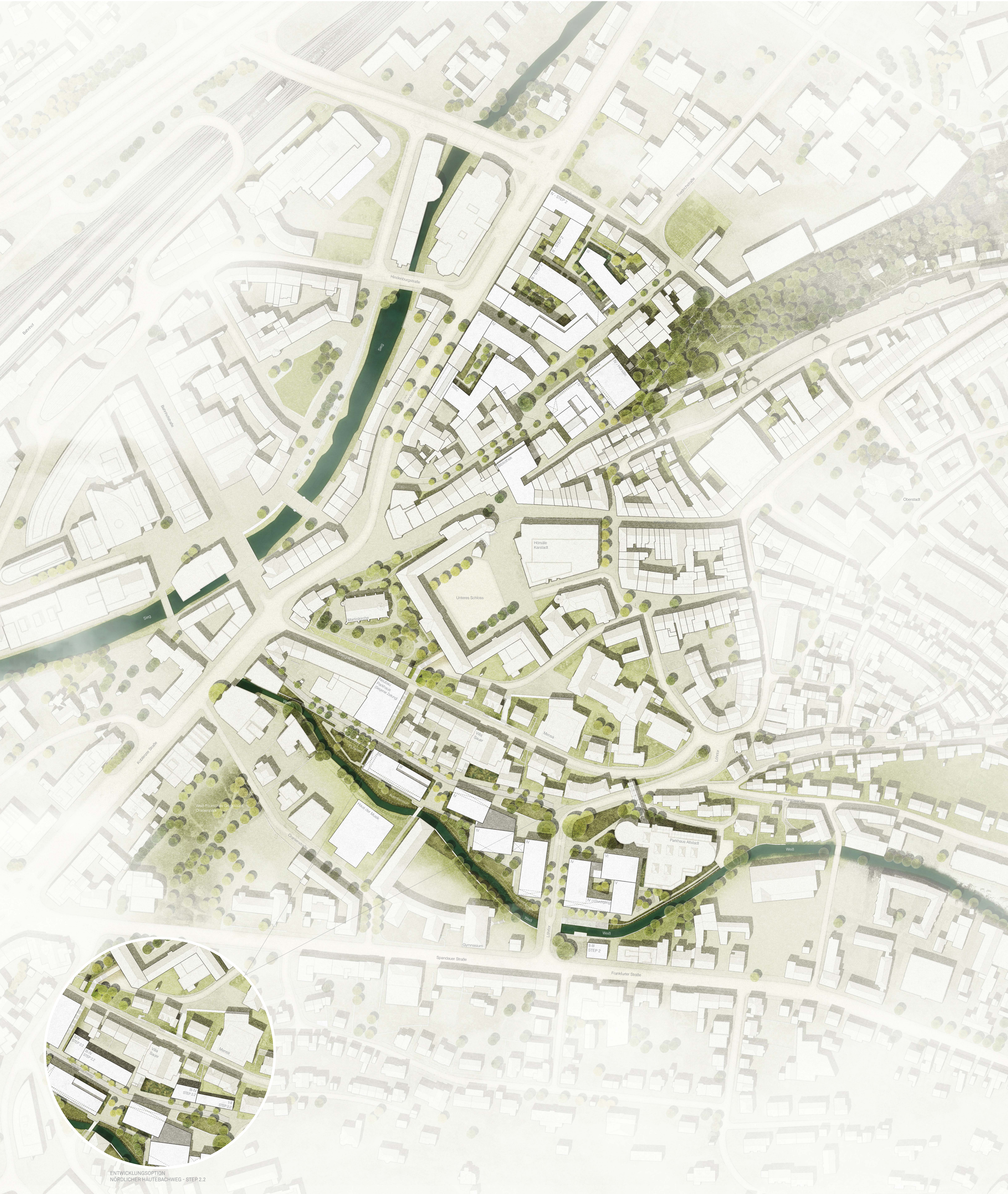
MASTERPLAN CAMPUS UNTERES SCHLOSS SIEGEN | DER CAMPUS ALS TEIL DER STADT MASTERPLAN LANGFRISTIGE ENTWICKLUNG - STEP 2

M 1:1.000 (DIN A0) STAND: 26. OKTOBER 2021