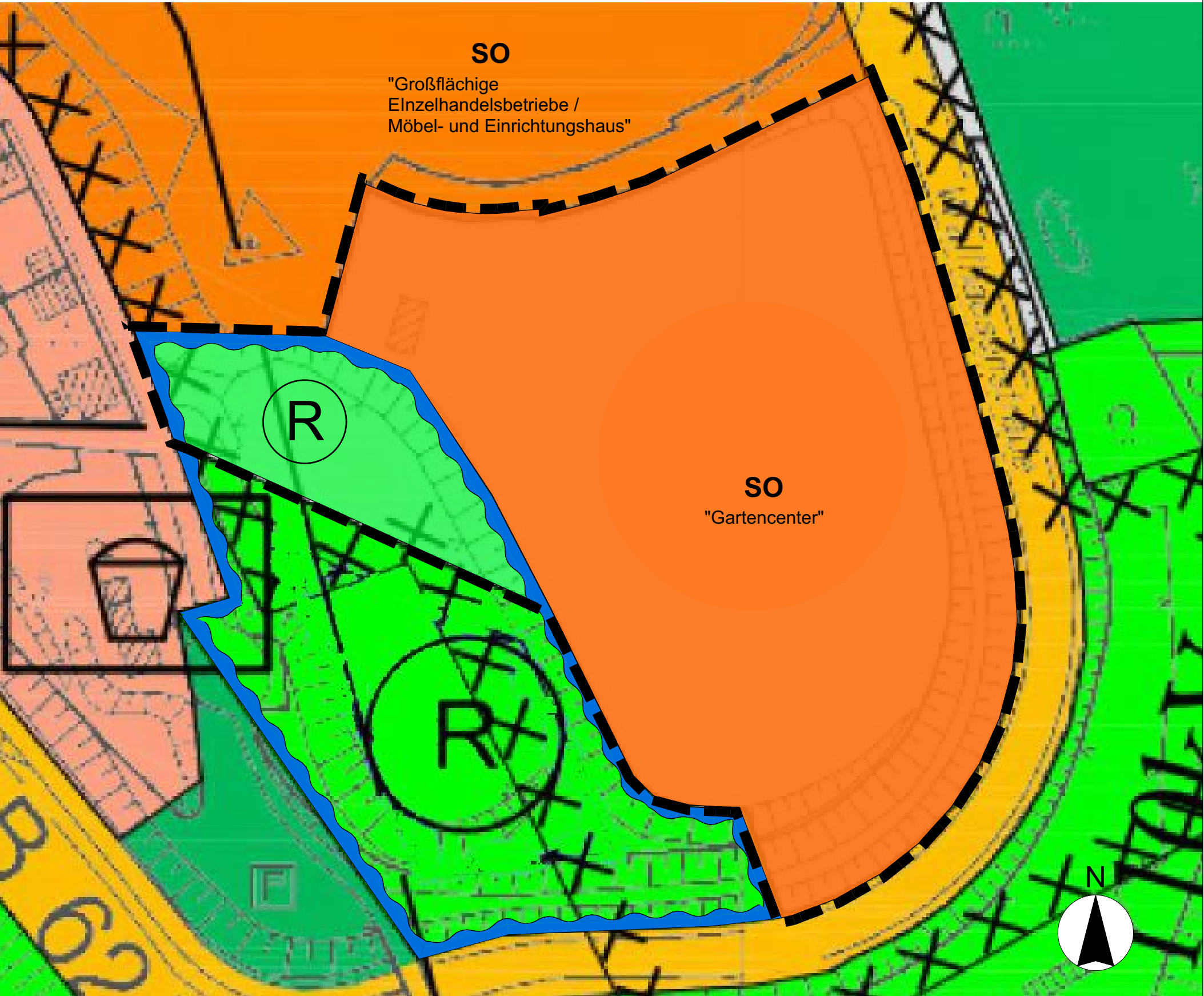
Plangebiet der 108. Änderung des Flächennutzungsplans der Universitätsstadt Siegen, M: 1:1.000