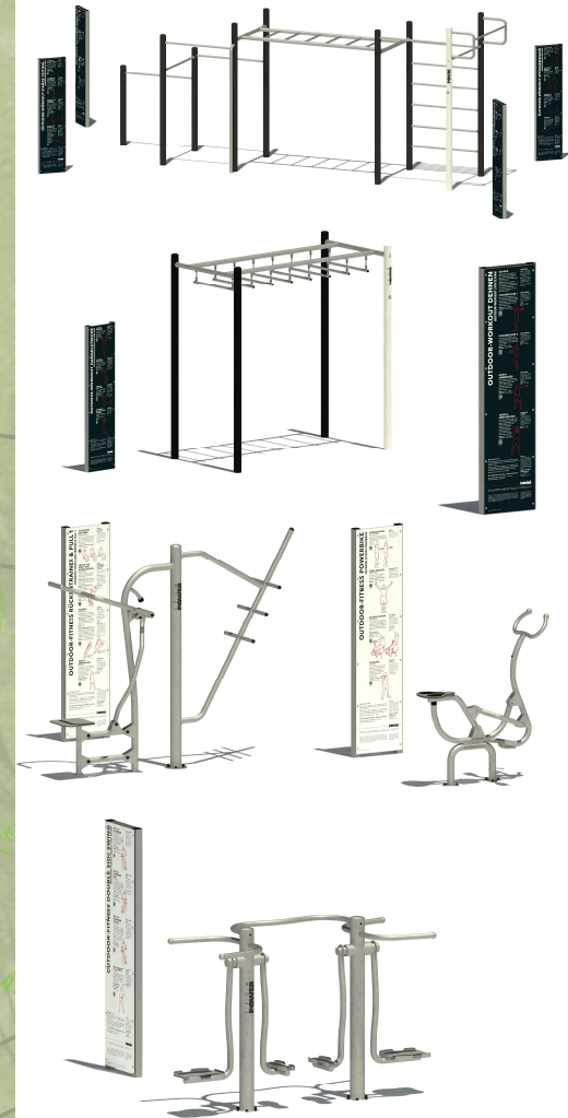
Bilder: Maier Spielgeräte