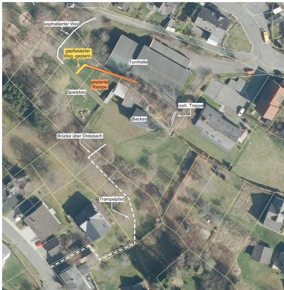
Skizze zum Bau einer Rampe zwischen Backes und Turnhalle (ohne Maßstab)

Planungen zur Einrichtung eines Treppenlifts an der vorhandenen Treppe wurden aufgrund der Anfälligkeit des Bauwerkes für Vandalismus verworfen. Zur Bedienung des Treppenlifts wäre aus Sicherheitsgründen zudem ein Schlüssel notwendig gewesen, der durch den Heimatverein verwaltet werden müsste. Dies hätte zur Konsequenz, dass der Treppenlift nur in Absprache mit dem Heimatverein genutzt werden könnte, wohingegen eine Rampe jederzeit nutzbar ist (beispielsweise auch durch Eltern mit Kinderwagen auf dem Weg zum Spielplatz). Auch die Einrichtung einer WC-Anlage am Backes wurde nicht weiter verfolgt, weil zum einen in der Turnhalle und somit in unmittelbarer Nähe eine moderne WC-Anlage vorhanden ist und zum anderen damit keine Verbesserung der Erreichbarkeit des Backes erzielt werden kann.